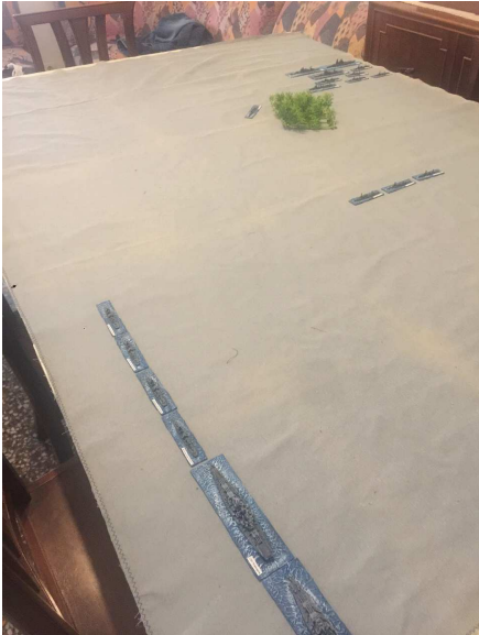
La Flotta USA

E' notte in quello che sar  ricordato come Iron Bottom Sound per il gran numero di navi affondate.