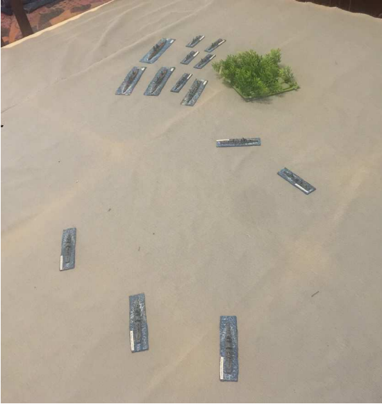
Le due flotte si affrontano

Le due flotte rompono le formazioni ed inizia uno scontro a media distanza che causa danni minimi alle più numerose navi giapponesi ed alcuni danni seri all'incrociatore South Dakota.