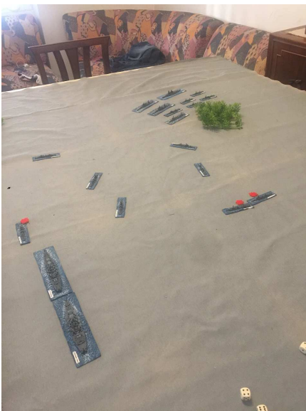
I primi danni

Le torpediniere della marina imperiale avvistano per prime la linea serrata delle navi Usa e lanciano i loro temibili siluri. Questa volta tuttavia il risultato del lancio   deludente.